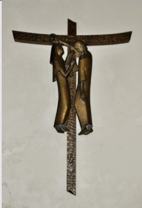
Vle Station - Une femme pieuse essuie le visage de Jésus (Véronique) Is 53,2-3