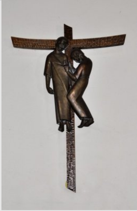
Xe Station - Jésus est dépouillé de ses vêtements Jn 19,23-24