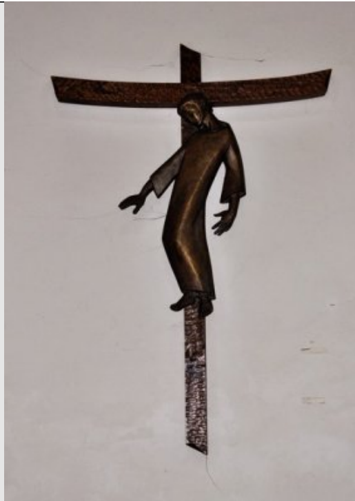
IIIe Station - Jésus tombe pour la première fois Is 53,6