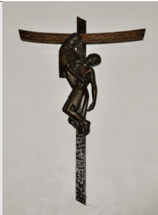
XIIIe Station - Jésus est descendu de la Croix Lc 23,50.52-53