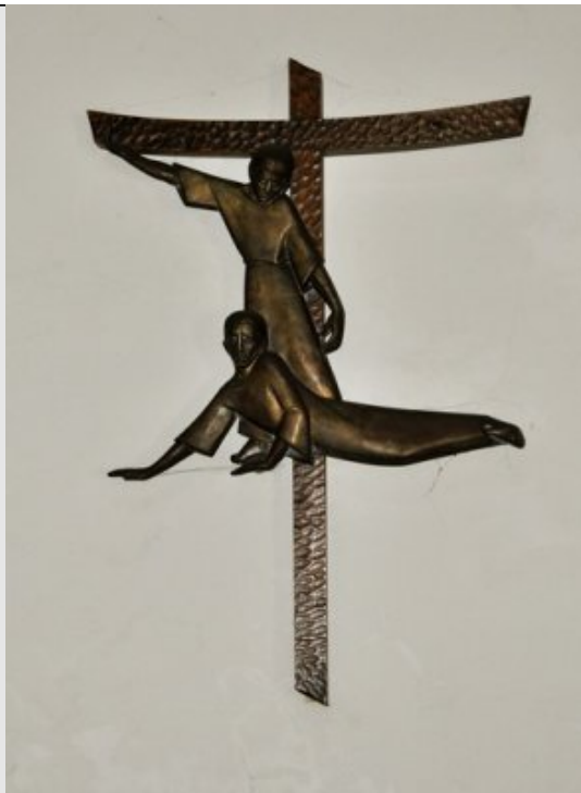
IXe Station - Jésus tombe pour la troisième fois Ph 2,6-7,8