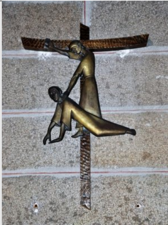
Vle Station - Jésus tombe pour la deuxième fois Lm 3, 1-2.9,16