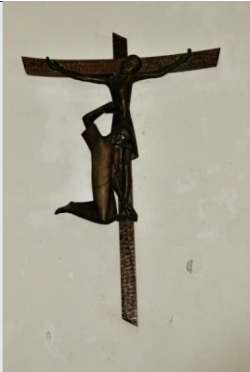
XIe Station - Jésus est cloué sur la Croix Ps 21, 17-18