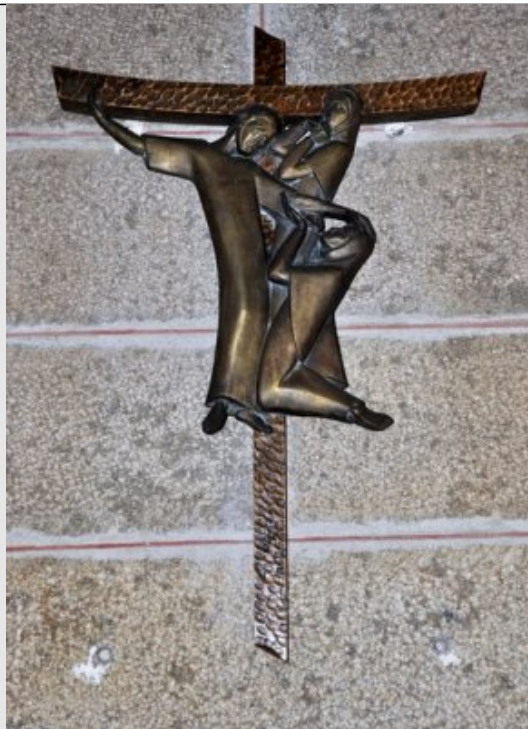
VIIIe Station - Jésus console les femmes de Jérusalem Lc 25,28-31