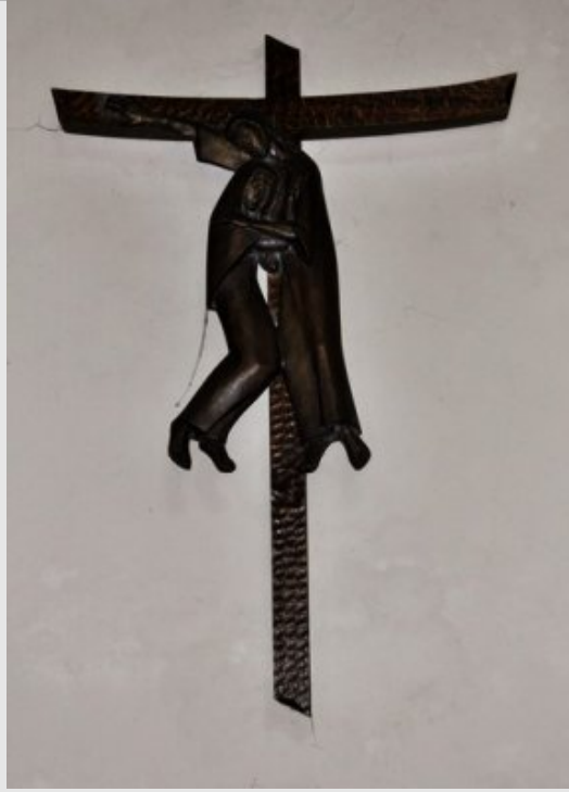
IVe Station - Jésus rencontre sa Mère Lc 2,34-35