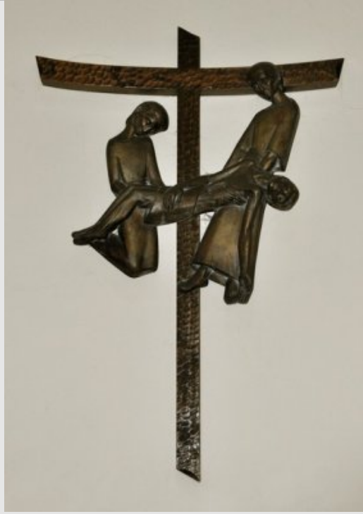
XIVe Station - Jésus est mis au tombeau Jn 19, 39-40