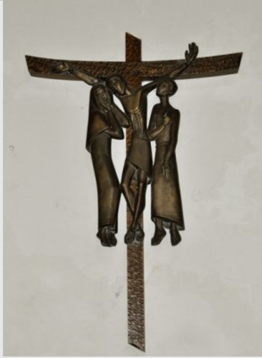
XIIe Station - Jésus meurt sur la Croix Jn 19,28-30