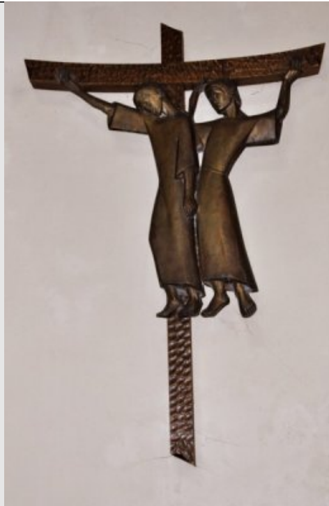
Ve Station - Simon de Cyrène aide Jésus à porter sa Croix Mt 27,32