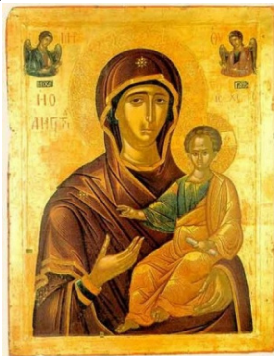
Icône de Marie Hodigitria 1535, monastère Iveron Mont Athos, Grèce